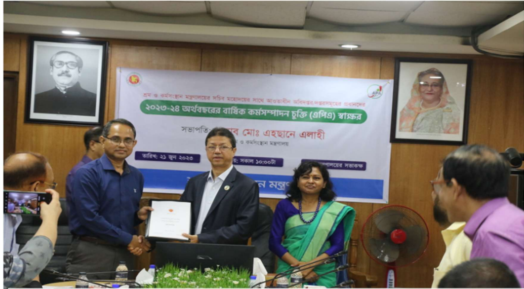
কলকারখানা ও প্রতিষ্ঠান পরিদর্শন অধিদপ্তরের ২০২৩-২০২৪ অর্থবছরের বার্ষিক কর্মসম্পাদন চুক্তি (এপিএ) স্বাক্ষরিত হয়েছে।