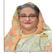
শেখ হাসিনা, এমপি