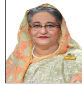
শেখ হাসিনা, এমপি