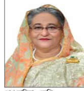
শেখ হাসিনা, এমপি