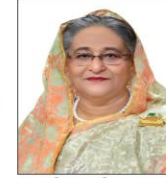
শেখ হাসিনা, এমপি