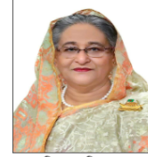
শেখ হাসিনা, এমপি