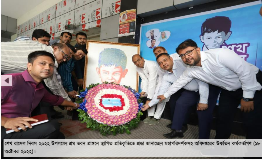
শেখ রাসেল দিবস ২০২২ উপলক্ষে শ্রম ভবন প্রাঙ্গণে স্থাপিত প্রতিকৃতিতে শ্রদ্ধা জানাচ্ছেন মহাপরিদর্শকসহ অধিদপ্তরের উর্ধ্বতন কর্মকর্তাগণ (১৮ অক্টোবর ২০২২)।