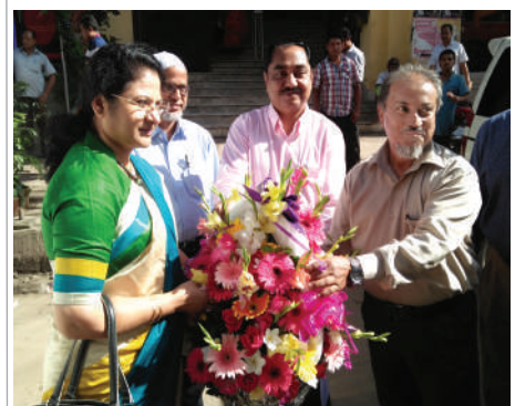
Inspector General, Additional Inspector General and others welcome the Secretary at DIFE head office

She urged to work with more devotion to build Bangladesh as a developed country by implementing the Bangladesh Labour Act and Bangladesh Labour Rules.