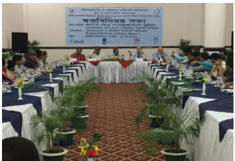
পোশাক কারখানা সংস্কার বিষয়ক উদ্বুদ্ধকরণ সভায় কারখানা মালিকদের সঙ্গে DIFE-এর পদস্থ কর্মকর্তাবৃন্দ।

সংস্কার কাজ দ্রুততর করতে কারখানা মালিকদের সঙ্গে ১৯ টি মতবিনিময় সভা করা হয়েছে। সভায় কারখানা সংস্কারে সমস্যা এবং বাধাসমূহ নিয়ে মতবিনিময় হয় এবং কারখানা মালিকগণকে প্রয়োজনীয় দিকনির্দেশনা প্রদান করা হয়। চিহ্নিত ত্রুটিসমূহ সংশোধন কর ত এপ্রিল ২০১৮ পর্যন্ত সময়সীমা নির্ধারণ করে দিয়ে মালিকপক্ষের সঙ্গে চুক্তি করা হয়। নির্ধারিত সময়ের মধ্যে সংস্কার সম্পন্ন করতে ব্যর্থ হলে কারখানার লাইসেন্স বাতিল, কারখানা বন্ধ করে দেওয়াসহ অন্যান্য আইনি পদক্ষেপ গ্রহণ করা ছাড়া বিকল্প থাকবে না মর্মে সভায় সংশ্লিষ্ট সকলের উপস্থিতিতে সিদ্ধান্ত হয়। মতবিনিময় সভার পর বর্তমানে মাঠ পর্যায়ে সংস্কার কাজের তদারকি করা হচ্ছে। চুক্তি অনুযায়ী সংস্কার সম্পন্ন হচ্ছে কিনা তা মূল্যায়নের জন্য নভেম্বর, ২০১৭ থেকে ফলোআপ সেশন শুরু হয়েছে।