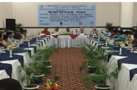
DIFE high-ups with factory owners in a view exchange meeting to expedite the garment factory remediation.

DIFE has completed 19 meetings with factory owners for remediation work. Problems and obstacles at the remediation process were discussed in the meetings. DIFE has given useful directions to the factory owners to speed up remediation. An agreement with the factory owners was made to complete their remediation by April 2018. In case of failure to complete the remediation within the stipulated time, DIFE will take stern action, e. g. cancellation of the license, closure of the factory and other legal steps. After the meetings with the factory owners, monitoring of remediation work at field level is going on. Follow-up session has been commenced from November 2017 in order to check whether the remediation work is on progress according to the contract or not.