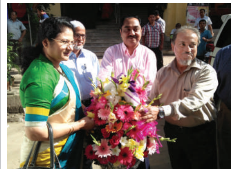
DIFE-এর প্রধান কার্যালয়ে সচিবকে অভ্যর্থনা জানাচ্ছেন অধিদপ্তরের মহাপরিদর্শক, অতিরিক্ত মহাপরিদর্শক এবং অন্যান্যরা।

বাংলাদেশ শ্রম আইন ও বাংলাদেশ শ্রম বিধিমালা বাস্তবায়নের মাধ্যমে বাংলাদেশকে উন্নত দেশ হিসেবে গড়ে তোলার লক্ষ্যে কর্মরত সকলের দায়িত্ব আরও নিষ্ঠার সাথে পালনের তাগিদ দেন তিনি।