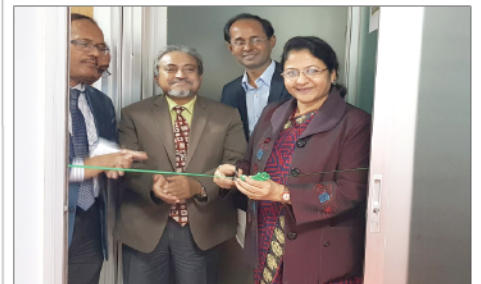
Afroza Khan, Secretary-in-charge of the Ministry of Labor and Employment, inaugurated a day-care centre at the head office.

The secretary gave instructions to the DIGs to implement Bangladesh Labour Act and Bangladesh Labour Rules in line with performing duties with devotion to make due progress and development of economic growth of Bangladesh. After the meeting, she inaugurated a day-care centre at DIFE's head office.