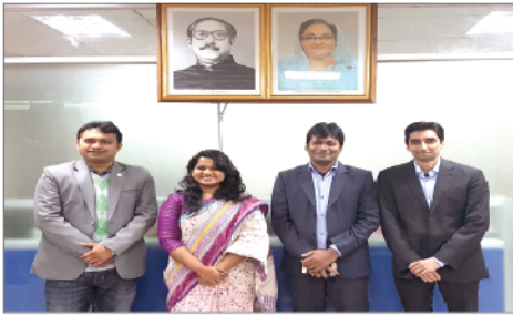
স্কলারশিপ প্রাপ্ত ডাইফ-এর কর্মকর্তাবৃন্দ।

ডেনিশ সরকারের “ইম্প্লুভিং দ্য হেলথ এন্ড সেইফটি অব ওয়ার্কারস ইন বাংলাদেশ থ্রু দ্য স্ট্রেন্দেনিং অব লেবার অথরিটিস”-শীর্ষক বাংলাদেশ ও ডেনমার্ক সরকারের স্ট্রাটজিক সেক্টর কো-অপারেশন চুক্তির আওতায় তারা এই বৃত্তি লাভ করেছেন।