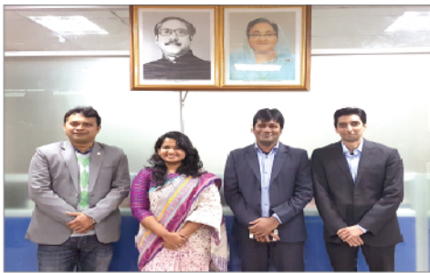
Scholarship recipients of DIFE.

They got the scholarship under Strategic Sector Cooperation Denmark-Bangladesh agreement project titled as "Improving the Health and Safety of Workers in Bangladesh through the Strengthening of Labour Authorities".