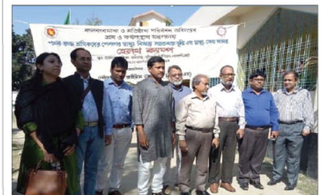
Inspector General and other high ups of DIFE along with local representatives at the medical camp.